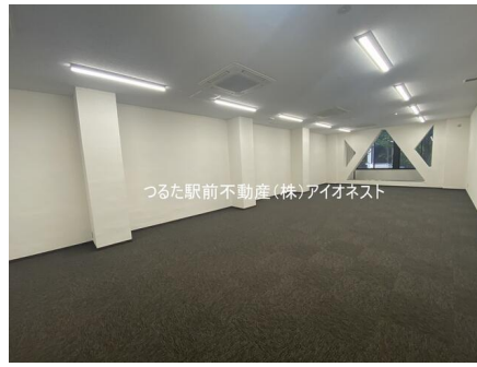
つるた駅前不動産(株)アイonest