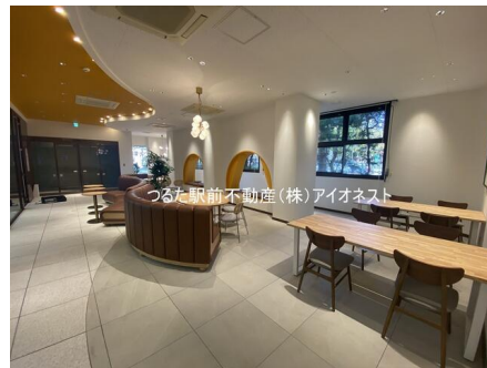
つるた駅前不動産(株)アイonest