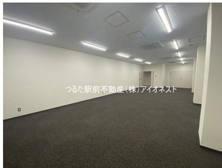
つるた駅前不動産(株)アイonest