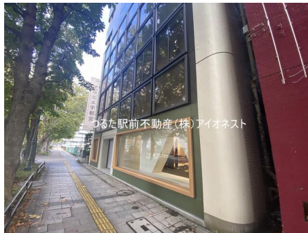
つるた駅前不動産(株)アイonest

角部屋,24時間利用可,土日・祝日利用可,IT重説対応物件,OAフロア,共用部分に男女別トイレあり,給湯,エアコン,個別空調,エレベーター