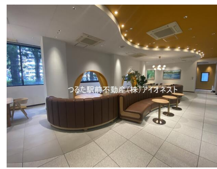
つるた駅前不動産(株)アイonest